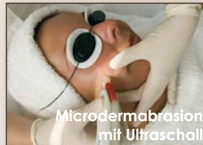
Microdermabrasion mit Ultraschall

Nur ein Peeling? Weit gefehlt! Erlernen Sie in diesem Workshop Behandlungen gegen Akne, Pigmentstörungen, zur Falttiefenreduzierung und zur Verkleinerung der Poren - durch die gezielte Kombination aus Microdermabrasion und Ultraschall.