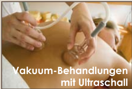
Vakuum-Behandlungen mit Ultraschall

Professionellste Antifaltenbehandlungen, Hautstraffungen, Anti-Aging sowie Anti-Cellulite-Behandlungen im Power-Workshop: So setzen Sie durch die optimale Kombination eines Vac/Spray mit einem Ultraschallgerät neue Impulse - mehr als nur Standard!